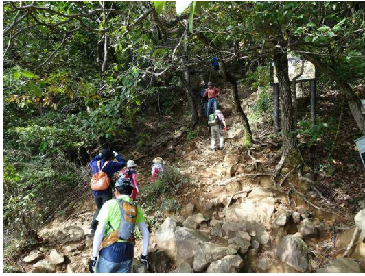
桐生市民に愛されるだけあって激混み