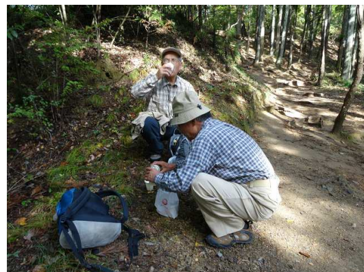
桐生駅から30分も歩き喉が渴いたので水分+αで喉を潤す。これが大間違い！！