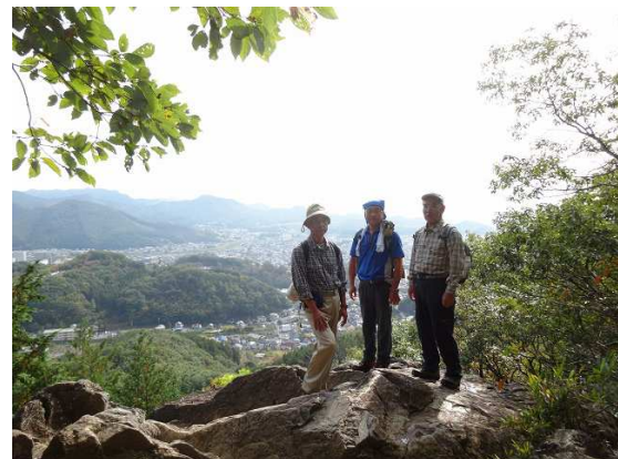
有名な？トンビ岩で記念撮影