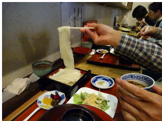
幅広麺！！90分待ったから旨いぞ