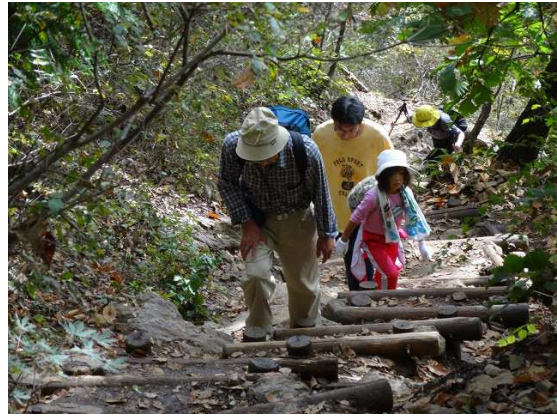
+αが効きすぎて絶不調 おじさん遅いなあ！追い越しちゃおっと！