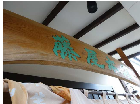
藤屋本店で「ひもかわうどん」