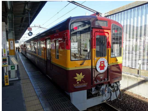
JR桐生駅に到着 わたらせ渓谷鐵道のあかがね号に挨拶

登山道は老若男女がひっきりなしに行き交っていた。まさに市民の山で社交場の雰囲気さえ感じる。