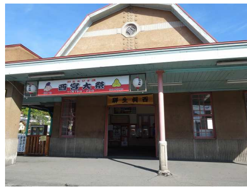
桐生駅から少し歩くとレトロな雰囲気の上毛電鉄「西桐生駅」