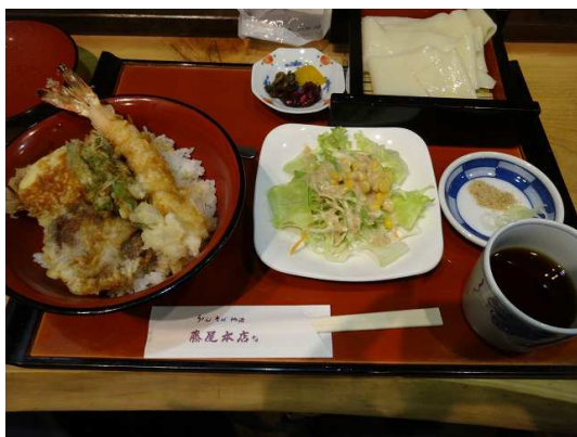
ミニ天丼セット@1250+50円