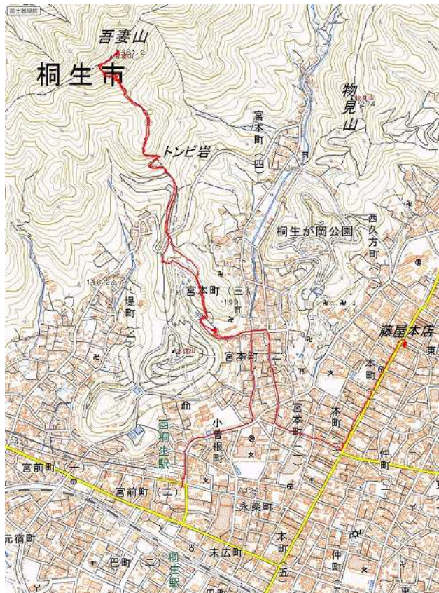
群馬山岳移動通信/2014

桐生駅 09:30ー09:51 吾妻公園ー10:21 トンビ岩ー11:15 山頂 12:03ー12:51 吾妻公園