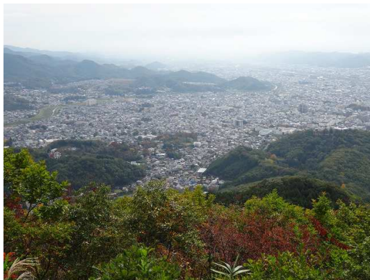
山頂から桐生の街並み