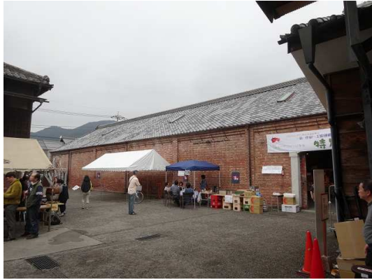
有隣館でイベント中