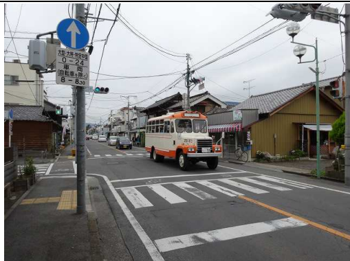
桐生はクラシックカーのパレード中