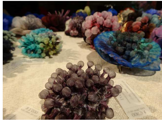
シルクのコサージュ@7500、高くても買えないのでお土産はストールでごまかす