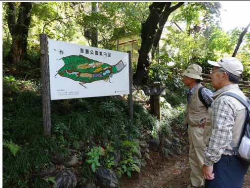
吾妻公園でルート調べる