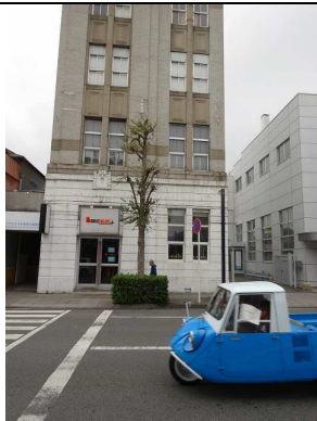
レトロなビルの前を疾走する 「マツダK360」